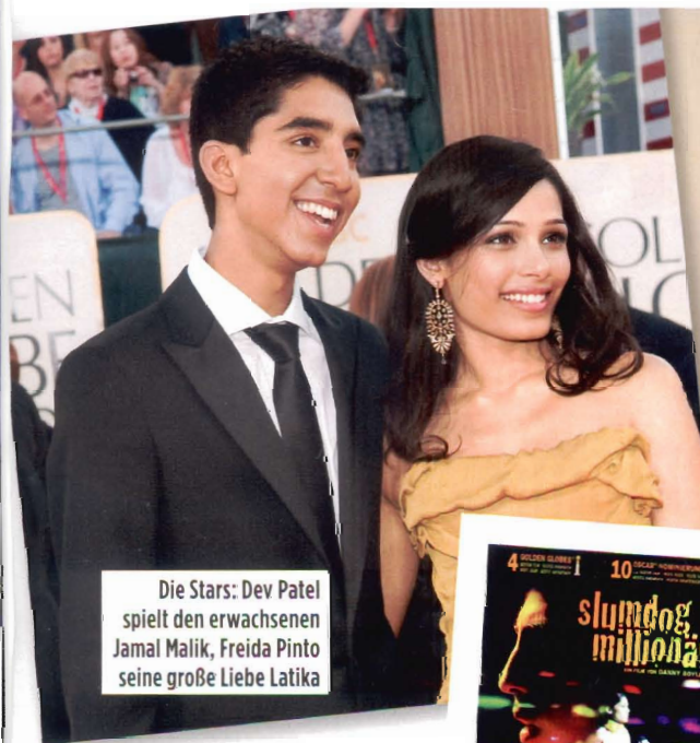
Die Stars: Dev Patel spielt den erwachsenen Jamal Malik, Freida Pinto seine große Liebe Latika

Der Oscar-Triumph von „Slumdog Millionär“ zeigt: Indien ist angesagt. Hotels im Himalaja setzen Design-Standards, und die Modemacher des Landes kleiden internationale Popstars ein