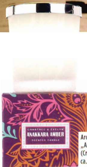
Aromatisch: Kerze „Anakkara Amber“ (Crabtree & Evelyn, ca. 29 Euro,

STILVOLL Anspielungen auf die indische Kultur sind in den neueren Hotels eher dezent. Im „Le Meridien“ in Neu-Delhi sucht man vergebens