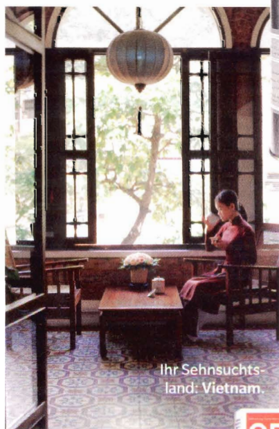
Ihr Sehnsuchtsland: Vietnam.