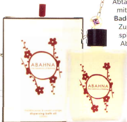
Abtauchen mit edlen Badeölen. Zum Beispiel von Abahna.

BELE Sie sind hin und her gehen zwischen allerhand Gegensätzen: Freiheit und Bindung, Stabilität und Aktivität, Kontinuität und Aufbruch. Die Entscheidung, in die es für Sie geht, gibt Pluto vor. Der Entwicklungsspezialist nistet sich in den nächsten Jahre in den Charakter Ihres Horoskops. Es geht um Freiheit und um Freundschaften. Sie werden Stellenwert besitzen. Sie haben ja schon seit längerem das Tierkreiszeichen für Intuition, das Ihnen manches in Ihrem Leben