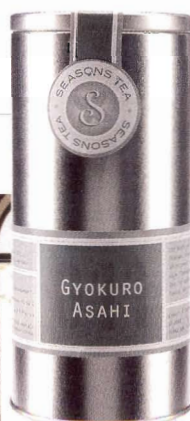
Edle grüne Tees wie Gyokuro aus Japan, hier von Seasons Tea.