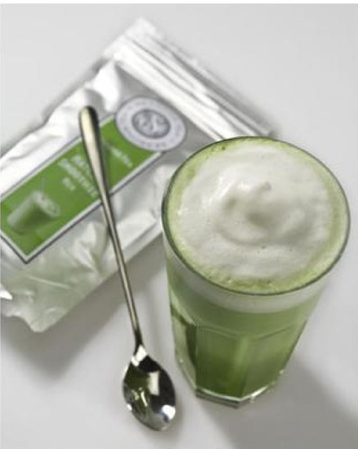
Kaffee-Konkurrenz in Grün: Der Matcha Latte